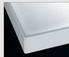
H プレーンホワイト